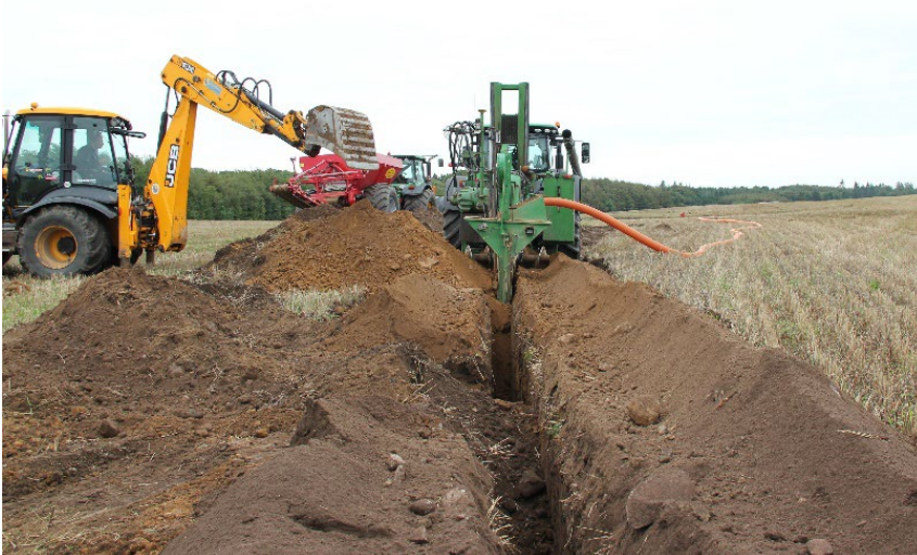
DIGITALT DRÆNDATA VED NYDRÆNING

I dag kan flere drænentreprenører levere et digitalt drænkort ved nye drænprojekter, ligesom nogle entreprenører også tilbyder at digitalisere de gamle papirdrænkort. Overfør de digitale drænkort til CropManager og hjælp landmanden med at få bedst muligt udbytte af sit nye drænarbejde.